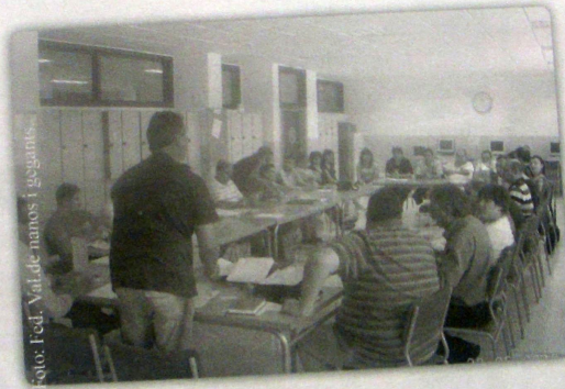
Ontinyent, Paiporta, València (els Bessons) y Vinaròs. Se constituyó la Junta Directiva formada por

El pasado 22 de mayo, en una segunda reunión en la misma población, el deseo se transformó en realidad y nació así la Federació Valenciana de Nanos i Gegants, formada inicialmente por 13 colles: Alcoi, Beniarrés, Benetússer, Benicarló, Benicàssim, Borriana, Castelló de la Plana (Corpus), Godella, la Vall d'Uixò,