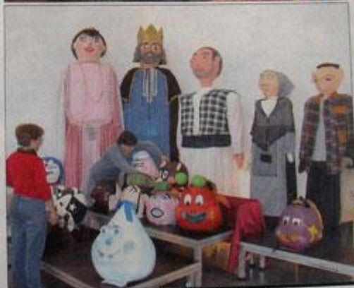
Muntant l'exposició al Centre de Cultura de Caixa Ontinyent.

bé es pot contemplar un recull de fotografies geganteres de tot el món i diverses obres artístiques creades per a l'ocasió a càrrec del col·lectiu Font d'Art. Audiovisuals i figures cedides pel Cercle Internacional d'Amics dels Gegants completen l'oferta d'esta exposi-