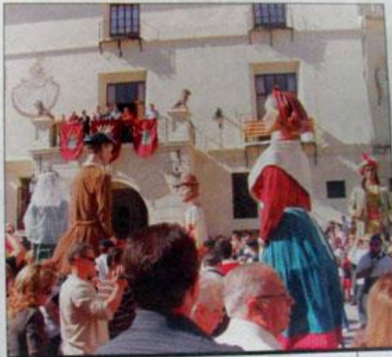
La gran festa dels gegants i cabets s'acosta.

Però la sembra d'esta cita ja fa temps que va començar. I s'espera la collita per al darrer diumenge d'octubre. Des de mitat d'any ve